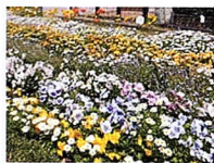
山公園 小山ヶ丘小学校前