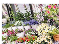
小山町1213-10 横土手/御嶽堂