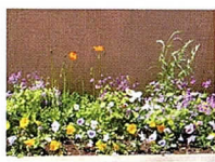
小山ヶ丘5-37 小山ヶ丘小学校前