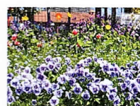
小山ヶ丘4-6-2 響きの丘

園児そして地域の方々に季 節のお花を楽しんでいただ きたい。そしてすてきなコ ミュニケーションの輪が広 がることを願っています。