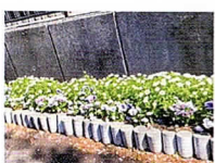
境川ロード 坂本橋東側 片所/坂本橋