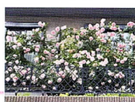
小山町5007-15 横土手/御嶽堂/まちだテクノパーク前