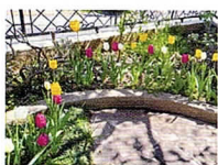
4月 小山町3068-1 多摩境駅/田端/坂本橋