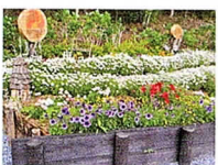
小山ヶ丘2-2-5 まちだテクノパーク前

テクノパーク駐車場北側の 花壇を季節の花で飾ります。 地域の皆様に楽しんでいた だけると幸いです。