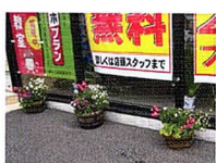
小山町617-1 中村不動入口