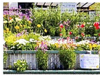
▲ 小山町4399番地(小山町ミツ目広場) 寿橋