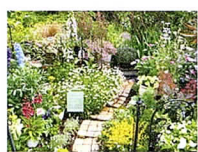
▲ 町田市小山町593-11 小山郵便局前/上中村/小山ヶ丘一丁目