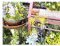
▲ 小山ヶ丘4-14-10 多摩美術大学坂上

宿根草と寄せ植えのミニガーデン。春と秋に花と雑貨の市を開催。ピリカハウスで検索。