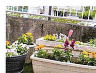
町田市小山町2492-7(朝日新聞サービスアンカー 京王多摩境) 片所

小山市民センターの向かい 側にある新聞販売店のプラ ンターです。花の苗が育っ たら見に来てください。