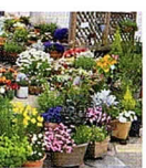
ちだテクノパーク前