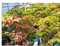
▲ 小山町1048-1 小山小学校前