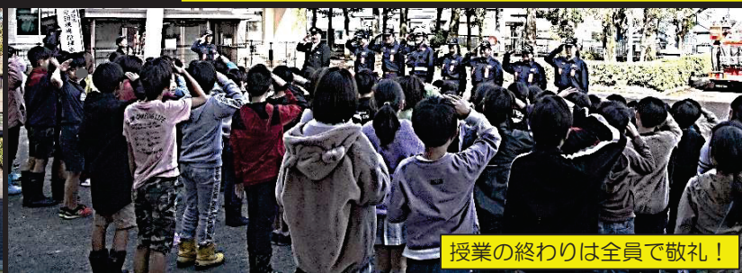
授業の終わりは全員で敬礼!