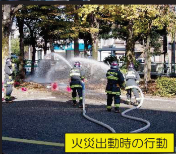
火災出動時の行動