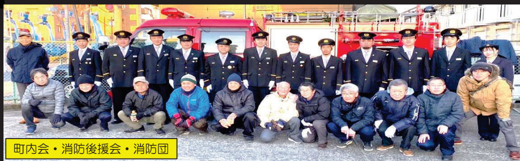
町内会・消防後援会・消防団