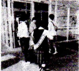
地域でお手伝いするボランティア部員