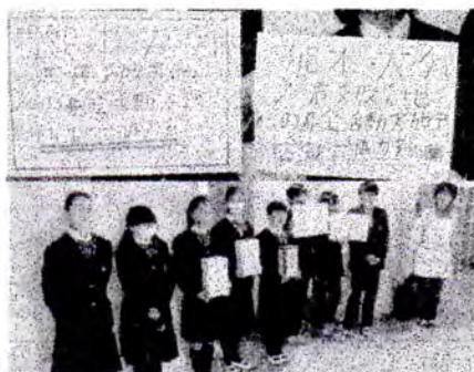
協力を呼びかけるボランティア部 4/23

4月14日から断続的に大きな被害をもたらしている熊本地震。様々な支援活動が行われている中、本校でもボランティア部が発起し、募金活動を開始しました。短期間でしたが12万3千506円という金額が集まりましたので被災地にお送りしました。5月3日付けの東京新聞に掲載されていますのでご紹介します。ご協力頂いた皆様、ありがとうございました。